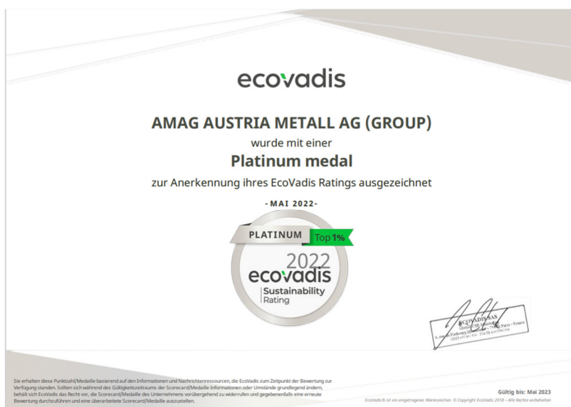
Bild 2: EcoVadis zeichnet die AMAG mit dem höchsten Status Platin aus.